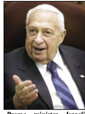
Prome minister Israeli, Ariel Sharon.

TEL AVIV—E prome minister Israeli e derechista Ariel Sharon, y e hefe di e partido Laborista, Amir Peretz, a bai di acuerdo diahuebs pa convoca eleccionnan anticipa entre fin di februario y fin di mart proximo, segun e lider progresista, na fin di un reunion cu e mandatario. Nos a fiha un fecha pa dialuna, dial di e sesion di Parlamento, riba e lei di disolucion di e camara, Peretz a bisa prensa.